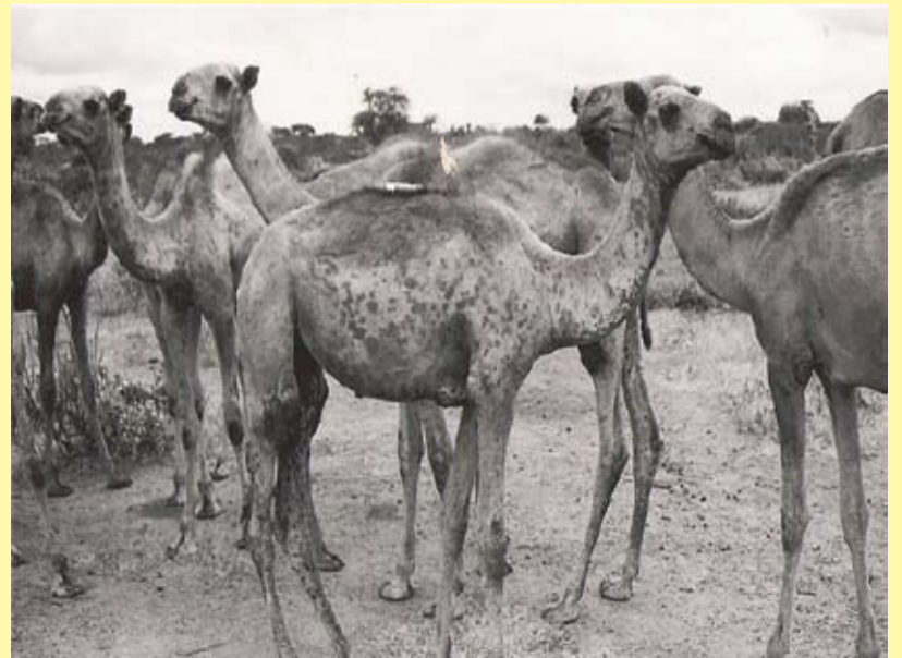
Nirgo ka bogsoodey cudur u eg Furuq

Furuqa Geelu wuxuu keeni karaa dhibaato weyn oo dhaqaale, taas oo ka kooban ; dhimasho uu geela qaar laayo, cadka iyo caanha geela oo yaraada iyo suuqgeynta (gudaha iyo dibeddaba) oo xanibanta.