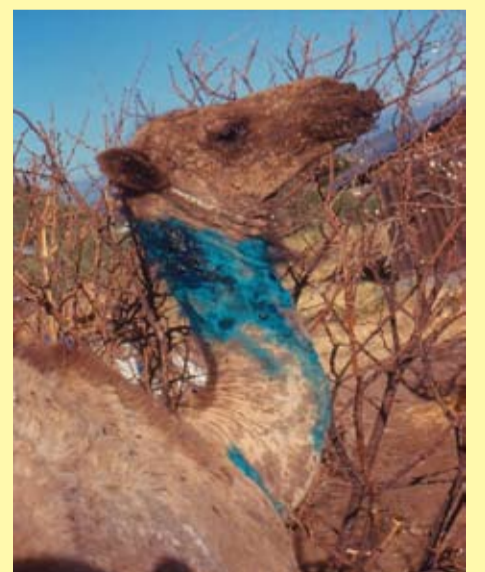
Nirig uu ku dhacay cudurka Afruur (Orf) oo lagu buufiyey daawo

Afruur waxaa keena fiirus ay isu dhow yihiin kan keena furuqa geela wuxuuna ku dhacaa badanaa nirgaha ama aaranka jiry 3 sanno iyo ka yar (eeg sawirkan hoose)