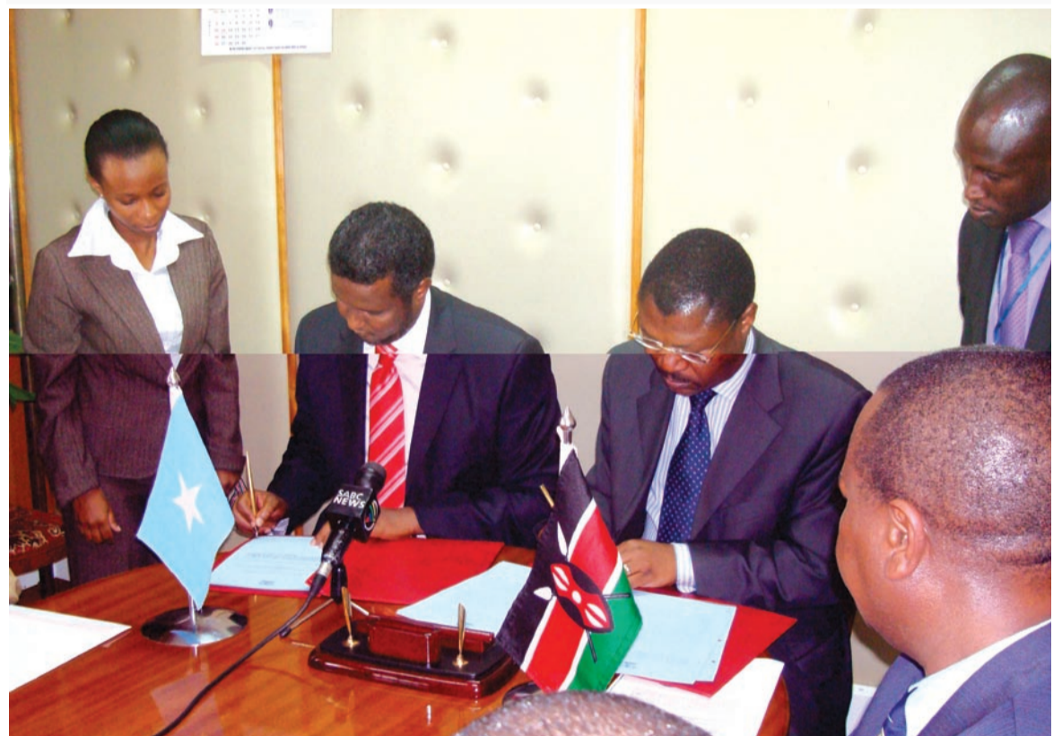
Saxiixa Heshiiska Soohdin-badeedka Kenya iyo Soomaalia -7Abriil 2009

Waa inta u dhexeysa xariiqa gaduudan iyo kan jaalaha ah ee biyaha Soomaaliya oo isku ah 350 Nautical miles (akhri Mabka sare).