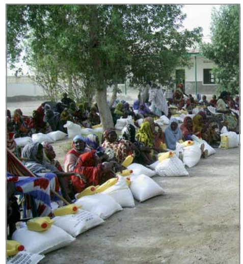
Qoysaska nuqul ee Daroole oo la siinayo raashin.

marinta iyo in ay saameyn ku yeeshaan madaxda iyaga oo ah dad wax og. Dhammaan waxqabadyadan waa kuwo ku dhisan baahi jirta: UNICEF waxa ay sii wadi doontaa taageerada ay siiso dadaalka nafaqeynta dadka ee Daroole iyada oo sii wadi doonta sameynta baaritaanka nafaqada iyo iyada oo u gudbinaysa halkii lagu daweyn lahaa dadka u baahan daaweynta iyo sidoo kale in ay u sameeyso Guddiga Horumarinta Bulshada karti-dhisid la xiriirta aqoonta nafaqeynta ee aasaasiga ah iyo sidoo kale in ay sahamiso waddooyinkii lagu abuur lahaa taageerada iyo wacyigelin loo sameeyo Maalmaha Caafimaadka Carruurta ee