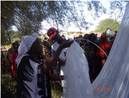
Haweeney Soomaaliyeed oo joogta Jubbada Hoose oo la tusayo sida loo diyaariyo marokaneecada cumriga dheer ee daaweysan .

“Jiro ragaaleed” ayaa Af-soomaaliga qaar loogu yaqaan duumada oo inta badan timaadda ka dib labada xilli-roobaad ee dalka. Aqoonta dadka degaanku ay u leeyihiin cudurka ayaa keentey in bulshadu ay xiiso u qaadaan ayna oggolaadaan in marokaneecada looga hortego duumada. UNICEF oo ka faa'iideysaneysa arrintaan ayaa waxa ay laga soo bilaabo 2005tii bulshada ay saameysey duumada ee Soomaaliya ay u qeybisey in ka badan 1 milyan oo Marakaneecooyinka Cumriga Dheer ee Daaweysan ah.