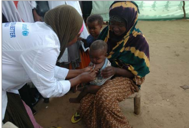
Ilmo laga tallaalayo jadeeco intii uu socdey ololaha Afgooye.

Iyada oo ay keentey dadka gudaha ku barkacay ee ku soo qulqulaya Afgooye, oo ay uga sii dartey haqab-beel la'aanta cuntada, UNICEF waxa ay bishii Maajo bilowdey in carruurta jirta 6 – 69 bilood ay si guud u siiso badarka lagu xoojiyey fitaamiinka iyo macaadiinta ee la yiraahdo UNIMIX waxaana si joogto ah carruur ku dhow 55,000 ugu qaybiya ururka Jumbo Peace and Development Organization (JPDO) . JPDO waxaa kale oo ay sameeysey wareeg cusub oo tallaalka jadeecada ah. Dhammaadkii Agoosto ilaa bilowgii Sebtembar ee sanadkan, carruur ka badan 142,600 oo da'doodu u dhaxayso 9 bilood ilaa 15 sano ayaa jadeecada looga tallaaley ololihii ugu dambeeyey ee laga sameeyey Muqdisho iyo Afgooye.